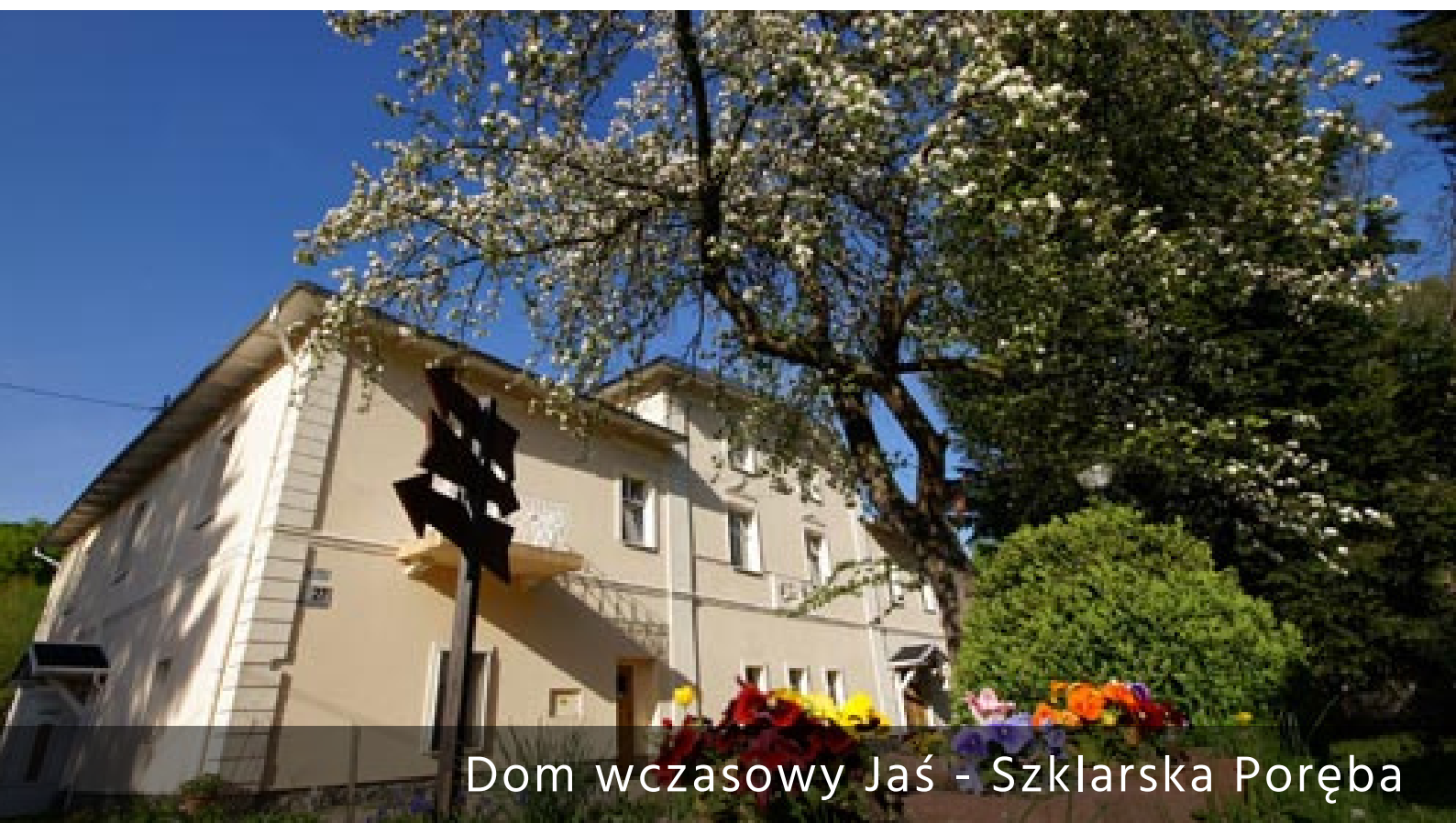
Dom wczasowy Jaś - Szklarska Poręba

Cena: 600 zł / osoba ( przy grupie 30 os + opiekunowie)